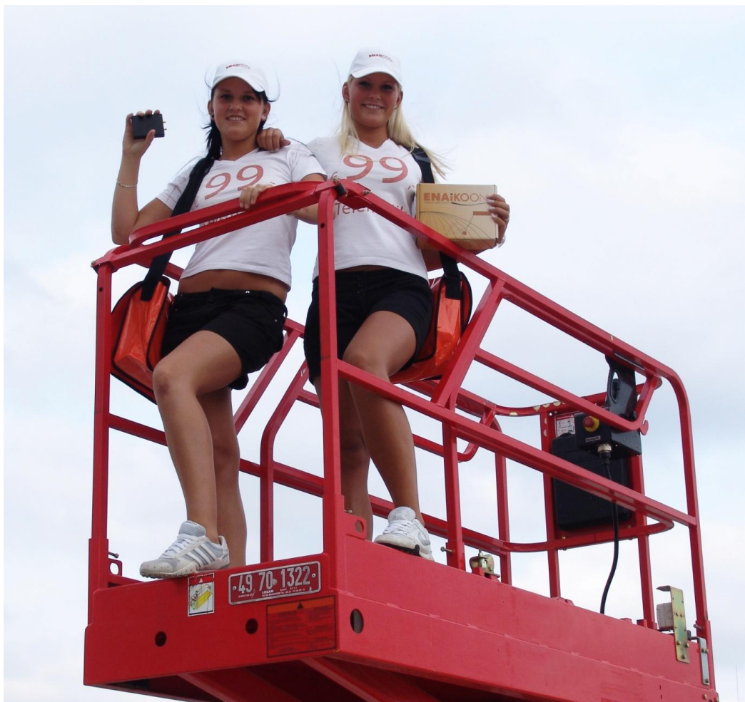
So attraktiv ist ENAIKOON-Telematik