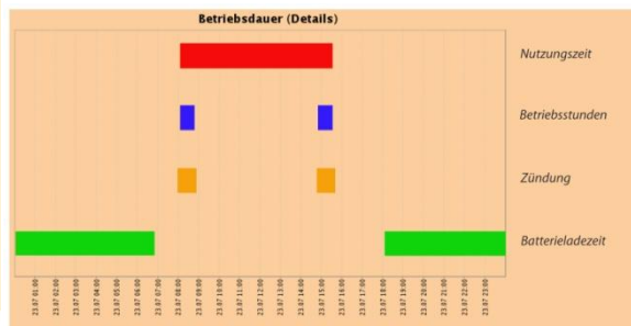
Betriebsstunden und Details