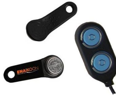
ENAIKOON driver-id: Lesegerät mit 2 Schlüsseln