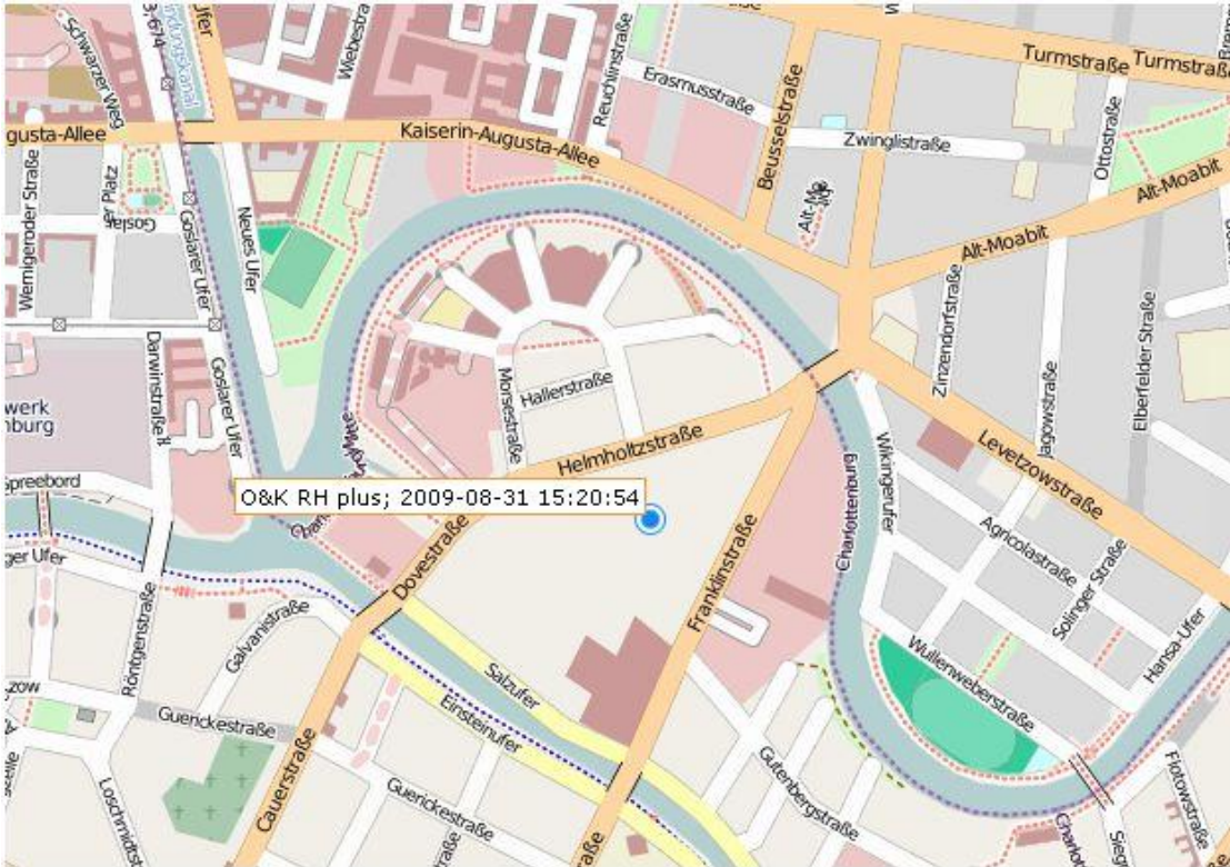
GPS-Lokalisierung mit Datum und Zeitstempel